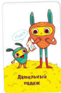
Рис. 5. Например, для карты «Дателный падеж» нельзя приводить примеры «Подарить открытку другу», «Отдать маме».

Если несколько игроков назвали пример одновременно, остальные игроки (игрок) выбирают, чей пример был интереснее, и отдают ему карту-добычу. Если игроки не смогли договориться, кому отдать добычу, карта уходит в отбой.