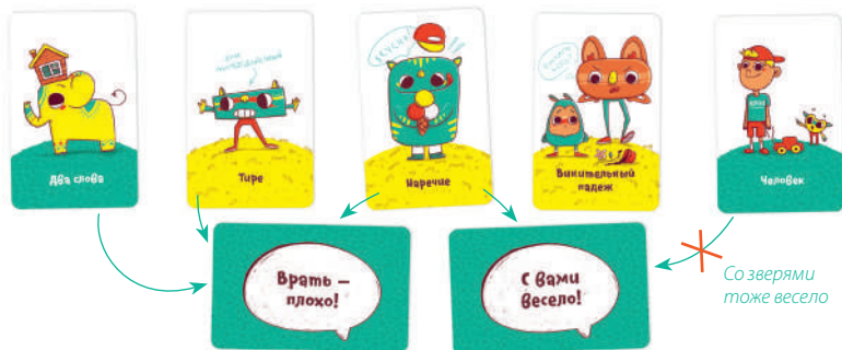
Рис. 6. Игроку выгодно выложить фразу «Врать — плохо!», к ней подходит сразу три признака.

Игроки ещё раз оценивают свои карты, выбирают одну карту с фразой, к которой подходит больше карт признаков с руки. Если во фразе нельзя однозначно определить признак (например, местоимение он / они — животные или люди), карту с этим признаком запрещено выкладывать в качестве подходящей (рис. 6).