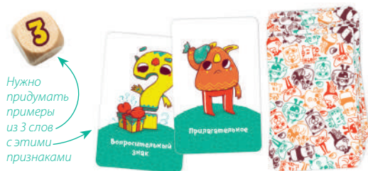
Рис. 4. В этом случае примерами могут быть: «Где большие чашки?», «Кто самый красивый?»

Нужно придумать примеры из 3 слов с этими признаками