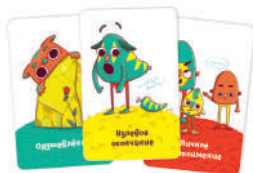
Рис. 1. Цвет фона определяет уровень сложности карт.

В игре есть четыре разных варианта правил. Выбирайте вариант по вкусу и настроению :)