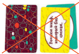
Рис. 2. Карты с фразами в этом варианте не нужны.

Нужно придумать примеры из 3 слов с этими признаками