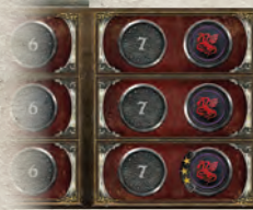
Пристройка к треку влияния

Разложите поле в центре стола. Как показано ниже, положите накладки Укуса и Орлиного Гнезда, а также пристройку к треку влияния.