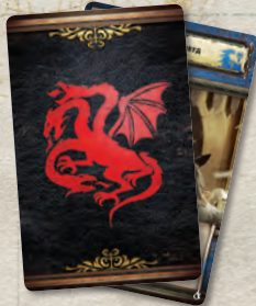
21 карта домов