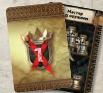
12 карт займов