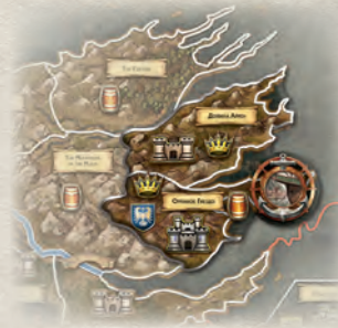
Накладка Орлиного Гнезда

Дом Таргариенов: если дом Таргариенов принимает участие в игре, положите дополнительное поле Эссоса справа от основного и выровняйте оба поля по нижнему краю. В противном случае уберите поле Эссоса в коробку.