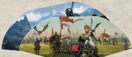
2 ширмы домов