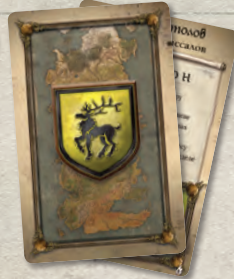
7 карт подготовки вассалов