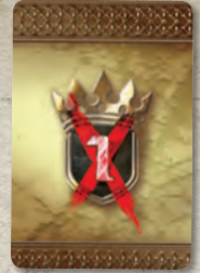
Рубашка карты займа

Не надейтесь, что ушлые банкиры из Браавоса простят вам долг. Получив займ, великий дом должен до конца игры платить ПРОЦЕНТ ПО ЗАЙМУ . В начале фазы Вестероса в порядке хода каждый игрок, имеющий займ, должен сбросить 1 доступный жетон власти за каждую полученную им карту займа. Если у игрока недостаточно жетонов власти на оплату процентов, то за каждый недостающий жетон власти игрок, владеющий Валирийским мечом, выбирает один из отрядов этого игрока в любом месте на поле и уничтожает его. Если игрок, неспособный оплатить процент, и есть владелец Валирийского клинка, то выбор за него делает игрок, занимающий следующую по очерёдности позицию на треке вотчин.