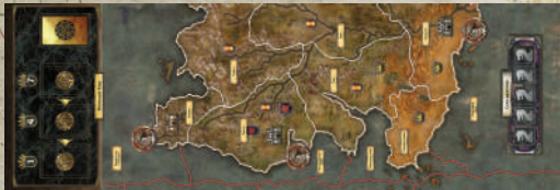
1 дополнительное поле Эссоса