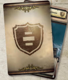
7 карт вассалов