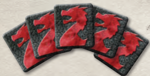
5 жетонов силы драконов