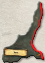
1 накладка Укуса