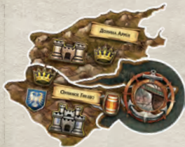
1 накладка Орлиного Гнезда