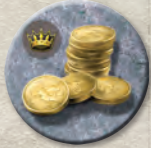
Жетон приказа Железного банка

Железный банк предоставляет займы лордам Вестероса. Благодаря этому вы сможете получить дополнительные отряды или помощь иного рода. Разыграв особый жетон приказа Железного банка (см. «Морские жетоны приказов» на стр. 10), вы можете взять один займ.