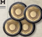
Один набор жетонов приказов вассалам

Положите принадлежащие вассалам жетоны победы рядом с треком Железного трона. Это МАРКЕРЫ ВАССАЛОВ . Затем возьмите наборы из 4 жетонов приказов вассалам по количеству домов вассалов (например, 2 набора, если в игре всего 2 вассала). Один такой набор получает игрок, занимающий первую позицию на треке Железного трона. Ещё один набор — игрок, занимающий следующую позицию, и так далее, пока не закончатся наборы.