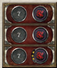
1 пристройка к треку влияния