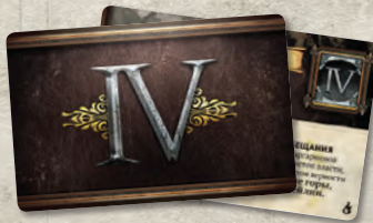
10 карт Вестероса (колода IV)